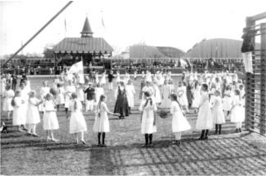
Malmö IP, "Lekrörelsen" hade uppvisning vid Baltiska spelen 1914. I bakgrunden syns spelens nöjespark.